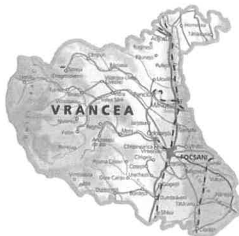
Harta 1. Poziția orașului Mărășești în județul Vrancea

În componența orașului, pe lângă orașul propriu-zis, intră localitățile: Doaga, Modruzeni, Haret, Pădureni și Călimănești.